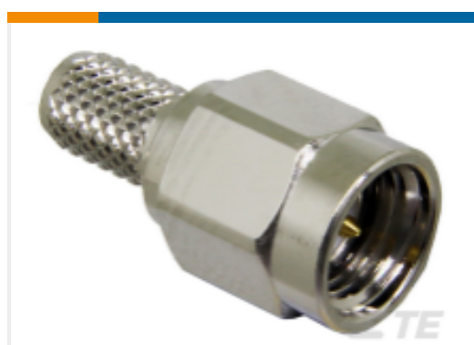
TE 产品编号CONSMA007-R58 SMA Plug 50 Ohm Cable Crimp