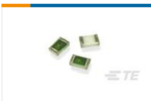
TE 产品编号2-1625868-8 RP 2A 0.25W 10R2 0.1% 25PPM 1K RL