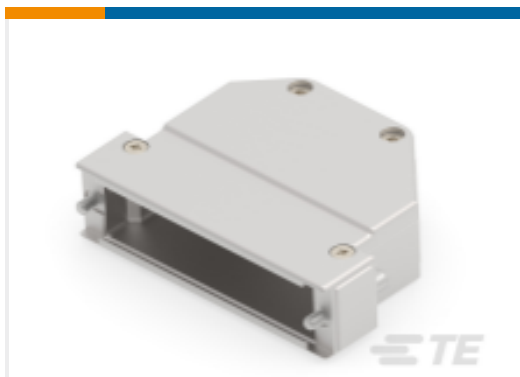
TE 产品编号1-2308346-1 FULL METAL HOODS SIZE 5