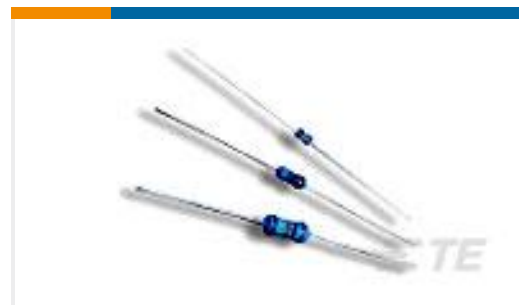
TE 产品编号1622796-6 YR1 0.1% 10K