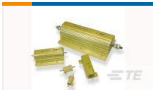
TE 产品编号3-1630019-3 HSC200 6R0 5%