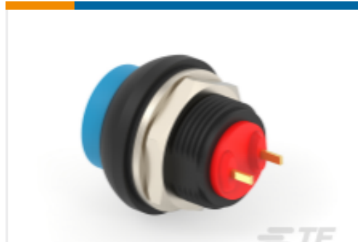
TE 产品编号2-2329328-0 PB OFF/ON HC BLU M4 TERM. IP68