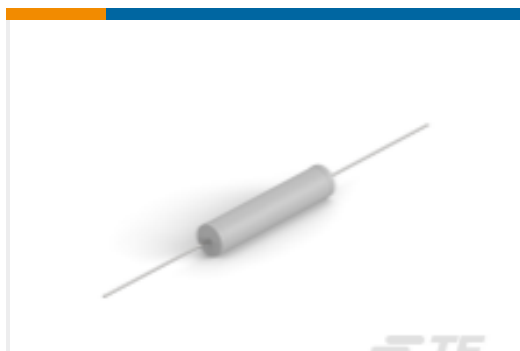
TE 产品编号9-2176415-0 8W STD M/OX 5% 150K