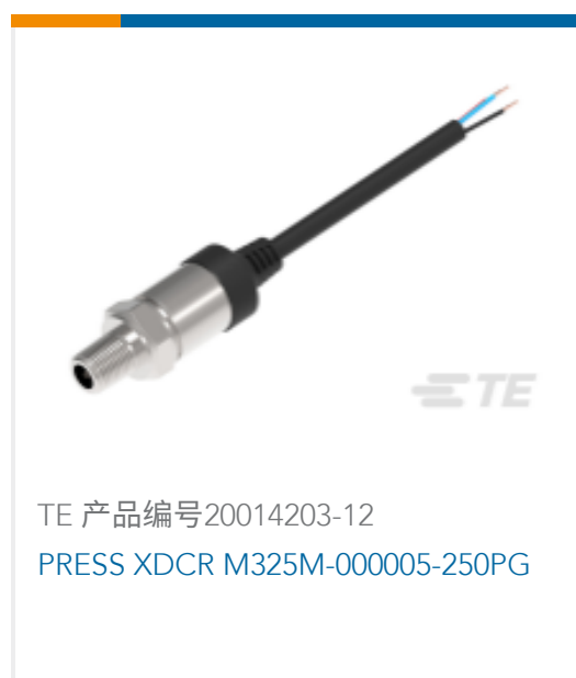
TE 产品编号 20014203-12 PRESS XDCR M325M-000005-250PG