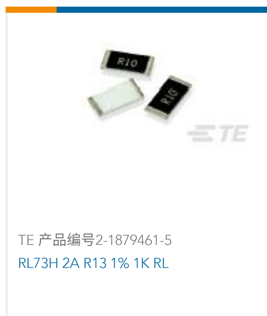
TE 产品编号 2-1879461-5 RL73H 2A R13 1% 1K RL