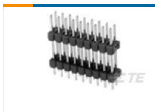
TE 产品编号5-146496-2 04 MODII HDR DRST UNSHRD STKG