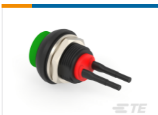
TE 产品编号2329359-9 PB ON/OFF HC GRE M1 TERM IP68 500MM LHS