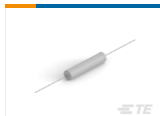
TE 产品编号9-2176415-0 8W STD M/OX 5% 150K