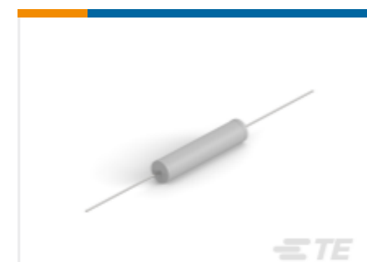
TE 产品编号9-2176415-1 8W STD M/OX 5% 160K