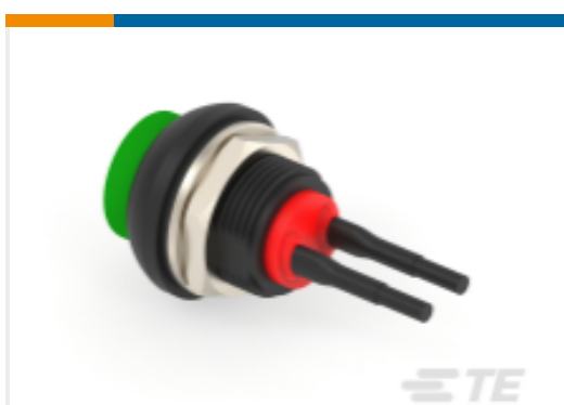
TE 产品编号2329359-9 PB ON/OFF HC GRE M1 TERM IP68 500MM LHS