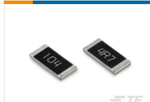
TE 产品编号2-2176455-5 CPF 0402 7R5 0.1% 25ppm 1K RL