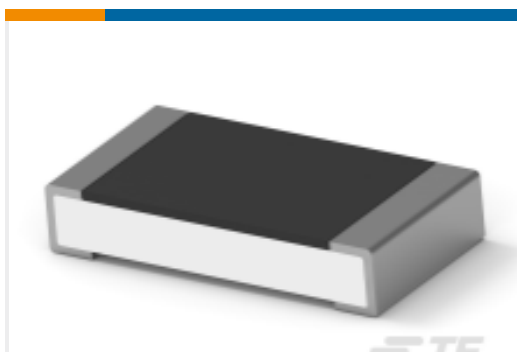
TE 产品编号1-2176391-0 RQ 1206 15K4 0.1% 10PPM 5K RL