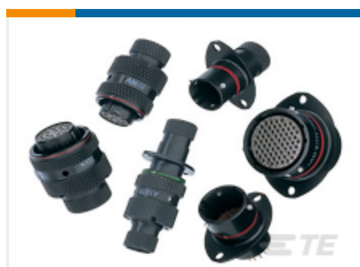
TE 产品编号AS824 PRO-CAP.TYPE 8. FOR PLUG.#24.