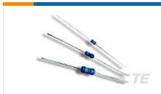
TE 产品编号1622796-6 YR1 0.1% 10K