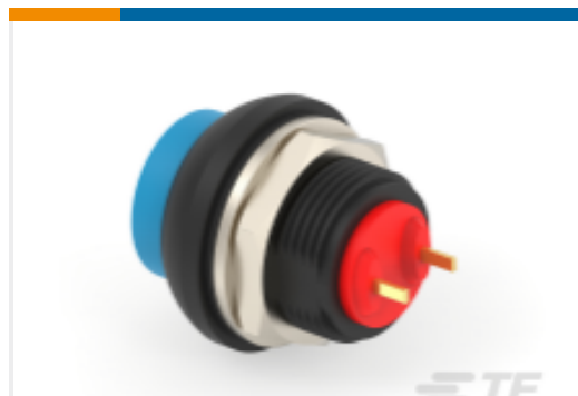
TE 产品编号2-2329328-0 PB OFF/ON HC BLU M4 TERM. IP68