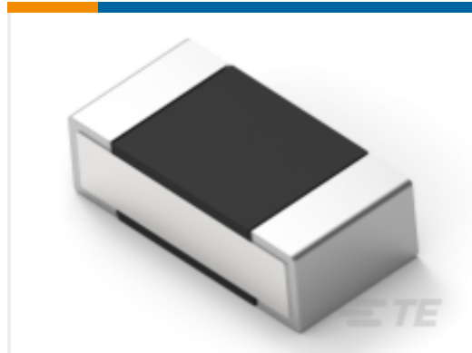
TE 产品编号7-2176305-3 RP 1E 0.1W 604R 0.1% 25PPM 5K RL