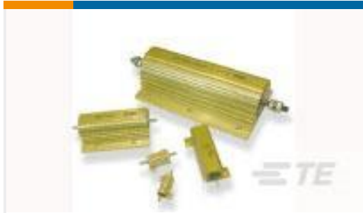
TE 产品编号9-1625971-5 HSA25 R01 10%