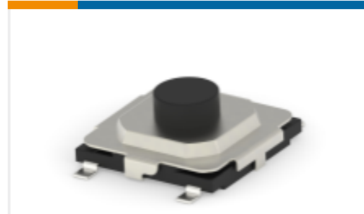
TE 产品编号2337238-3 TACT MINI GW 5.2X5.2X2 160GF