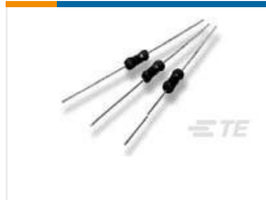
TE 产品编号1-1879353-9 RR02 5% 24K AMMO