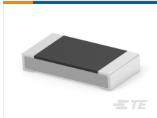
TE 产品编号2-2176392-9 RQ 1206 261K 0.1% 10PPM 5K RL