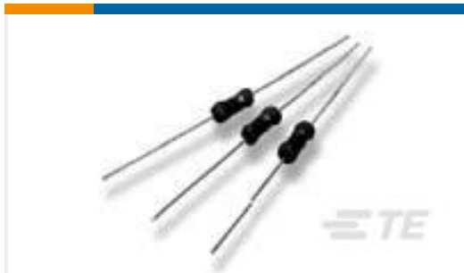
TE 产品编号7-1879354-5 RR03 5% 390R AMMO