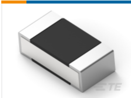
TE 产品编号3-2176307-2 RP 1E 0.1W 26K1 0.1% 25PPM 5K RL