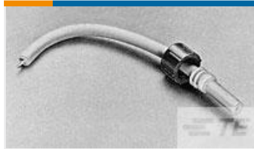
TE 产品编号1-830611-0 LGH 1/2 SNGL MLD END