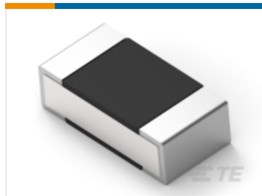
TE 产品编号3-2176307-2 RP 1E 0.1W 26K1 0.1% 25PPM 5K RL