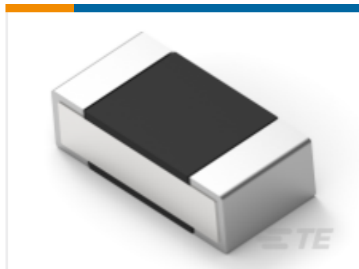
TE 产品编号7-2176305-3 RP 1E 0.1W 604R 0.1% 25PPM 5K RL