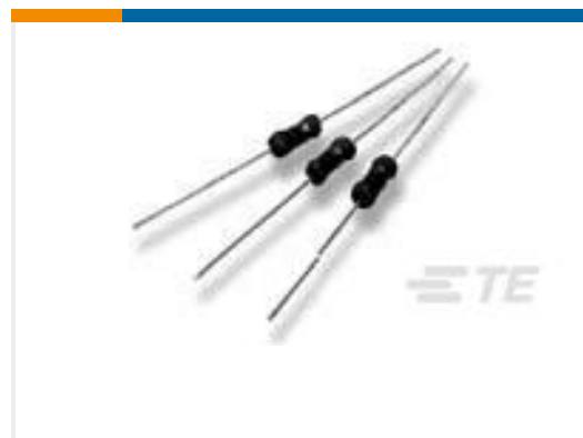
TE 产品编号7-1879354-5 RR03 5% 390R AMMO