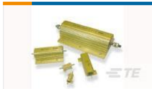
TE 产品编号9-1625971-5 HSA25 R01 10%