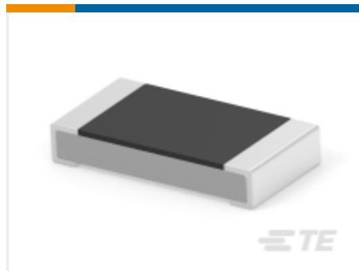
TE 产品编号2-2176392-9 RQ 1206 261K 0.1% 10PPM 5K RL