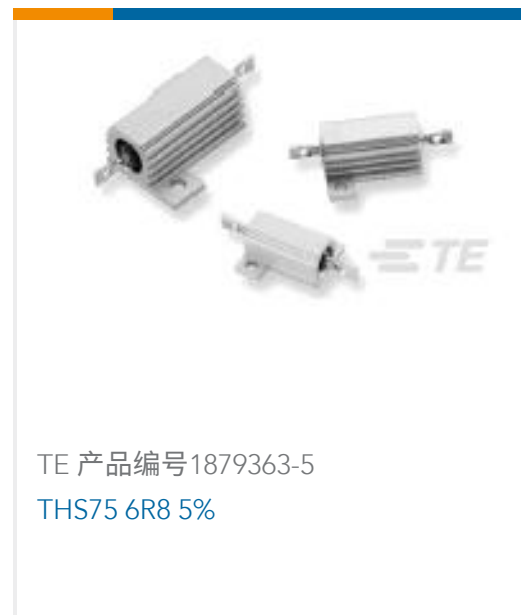
TE 产品编号1879363-5 THS75 6R8 5%