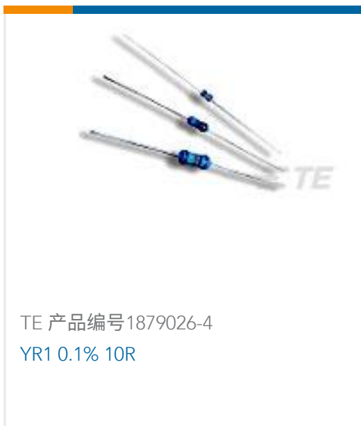
TE 产品编号1879026-4 YR1 0.1% 10R