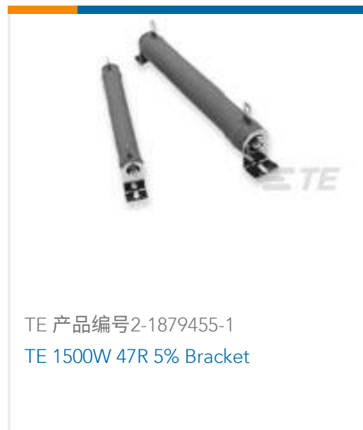
TE 产品编号2-1879455-1 TE 1500W 47R 5% Bracket