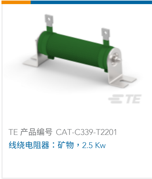
TE 产品编号 CAT-C339-T2201 线绕电阻器：矿物，2.5 Kw