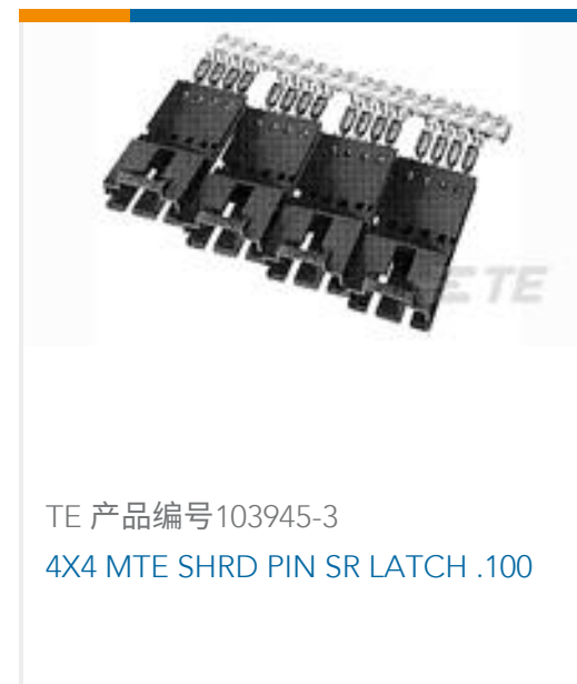
TE 产品编号103945-3 4X4 MTE SHRD PIN SR LATCH .100