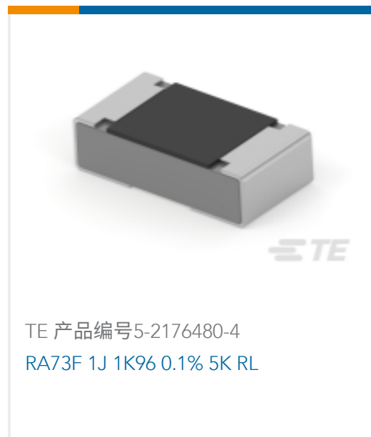
TE 产品编号5-2176480-4 RA73F 1J 1K96 0.1% 5K RL