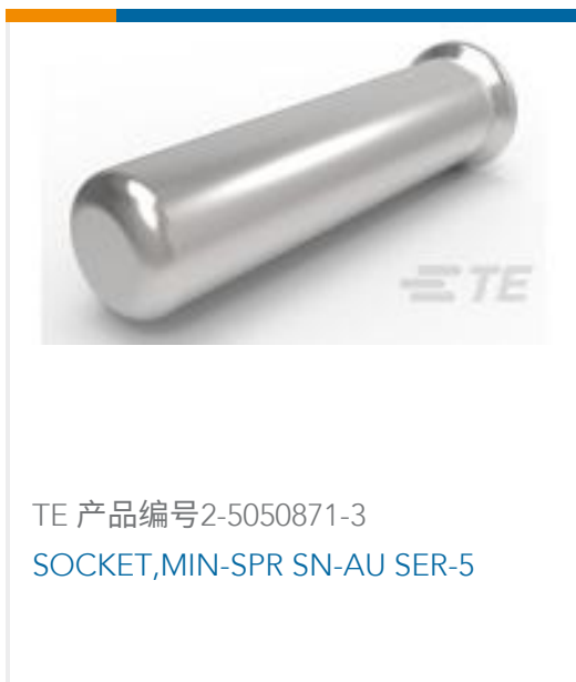
TE 产品编号2-5050871-3 SOCKET,MIN-SPR SN-AU SER-5