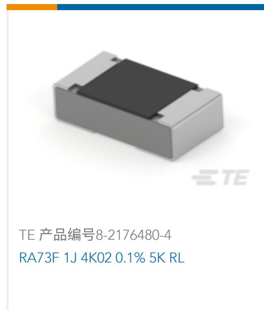
TE 产品编号8-2176480-4 RA73F 1J 4K02 0.1% 5K RL