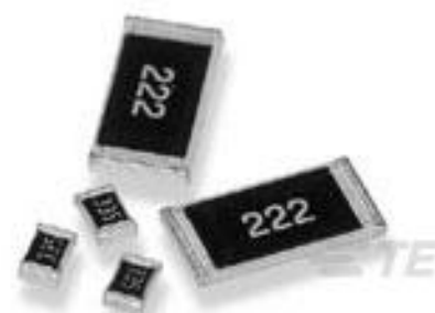
TE 产品编号 9-1879510-1 CRGH0805 1% 10K 0.33W