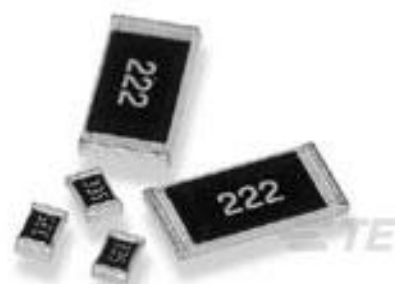
TE 产品编号 1879513-1 CRGH1206 1% 10R 0.5W