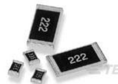
TE 产品编号 1-1879502-0 CRGH2512 5% 33K 2W