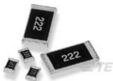
TE 产品编号 6-1879501-0 CRGH2512 5% 300R 2W