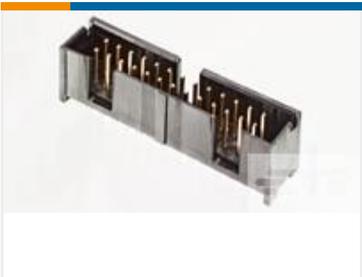
TE 产品编号2-1761603-9 IDC LOW PRO HDR 26P VERT BLUE