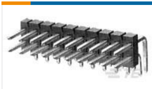
TE 产品编号826662-4 4P AMPMODU II STIFT LEI