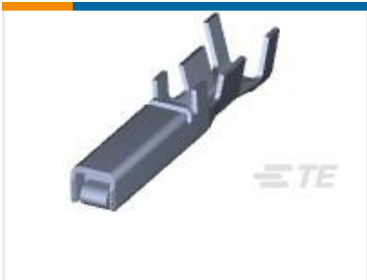
TE 产品编号175196-3 DYNAMIC D-3 REC CONT/L AU 0.76