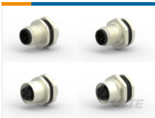
TE 产品编号T4133012051-000 M12 面板安装焊杯