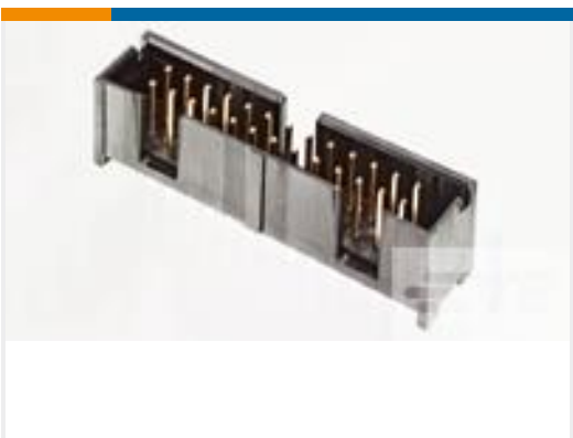
TE 产品编号2-1761603-9 IDC LOW PRO HDR 26P VERT BLUE