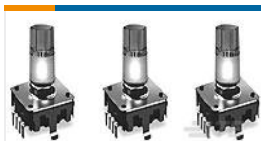
TE 产品编号 1-1879749-7 LED ENCODER 12MM HORIZ SW GR /RD