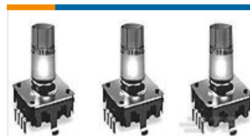
TE 产品编号 4-1879314-5 DPL12S 24P 24DET 25K RD/GRN