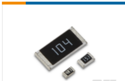
TE 产品编号2-2176339-2 CRGCO 0603 560R 1%