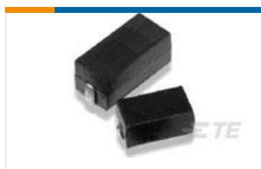
TE 产品编号6-1879234-4 SMF5 220K 5%