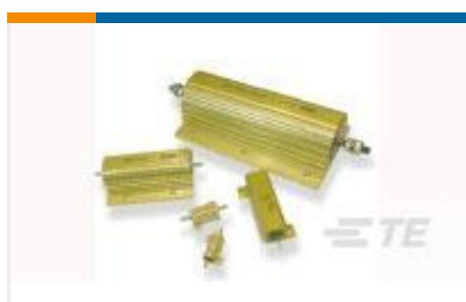
TE 产品编号4-1625966-3 HSA10 68R 5%