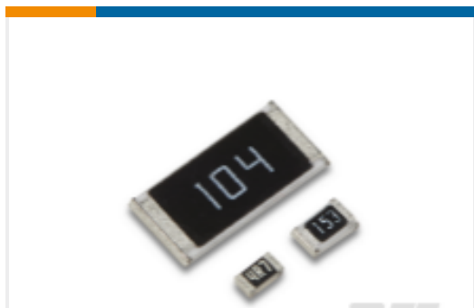
TE 产品编号4-2176347-7 CRGCO 2010 68K 1%