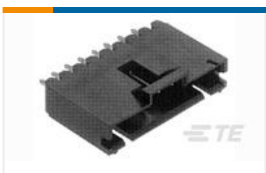
TE 产品编号5-103735-1 02 MTE HDR SRST LATCH .100CL