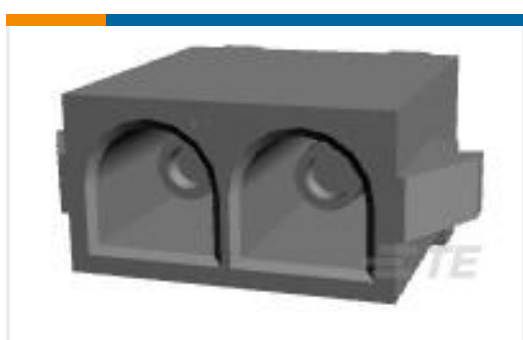
TE 产品编号350824-1 02P UMNL HDR ASSY PC 94VO