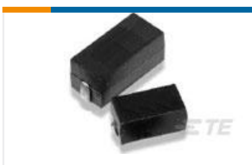
TE 产品编号4-1879234-5 SMF5 36K 5%