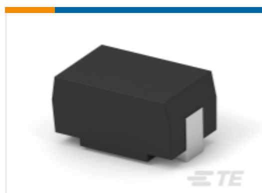
TE 产品编号2-1879234-6 SMD 功率电阻器：7 瓦特，200-2M 欧姆