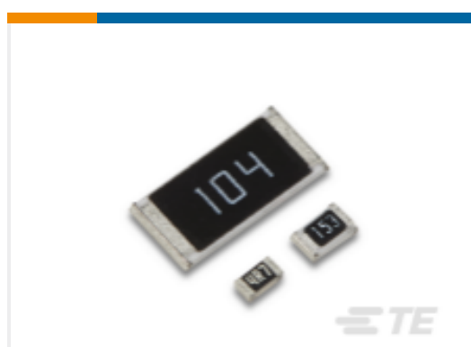
TE 产品编号2176343-2 CRGCQ 1206 12R 1%