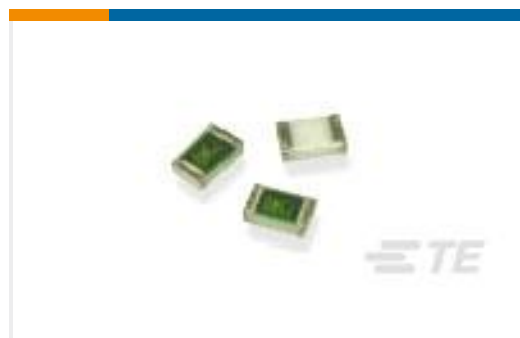
TE 产品编号2-1625868-7 RP 2A 0.25W 10R 0.1% 25PPM 1K RL