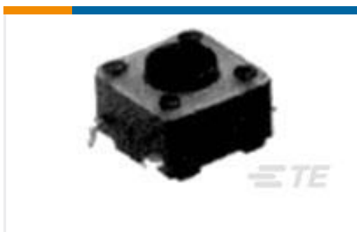
TE 产品编号3-1437565-0 FSM2JSMATR=ON T/R