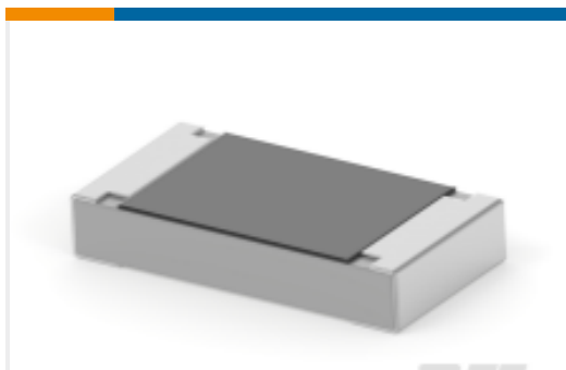
TE 产品编号3-2176344-6 CRGCO 1206 680K 5%