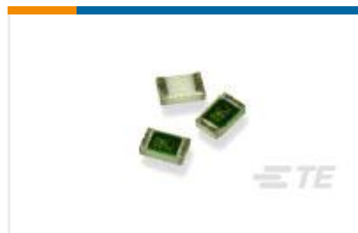
TE 产品编号5-1879337-9 CPF 0603 10K 1% 50PPM 1K RL