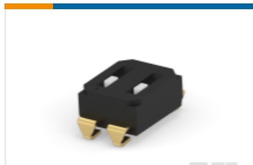
TE 产品编号1-2319848-2 END STACK DIP 2P J RECESS TUBE