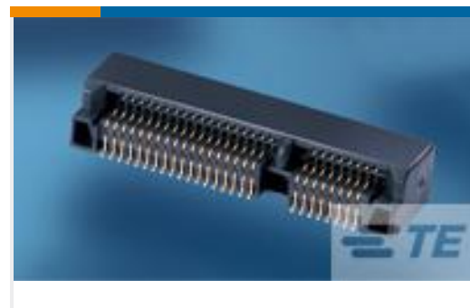
TE 产品编号2041119-1 mSATA/mini PCI-E 4H Type I G/F