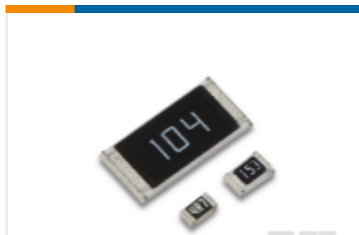
TE 产品编号5-2176349-5 CRGCO 2512 330K 1%