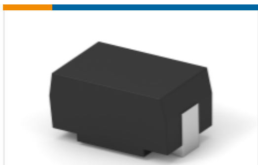
TE 产品编号3-1879233-7 SMD 功率电阻器 : 7 瓦特 , .10-500 欧姆