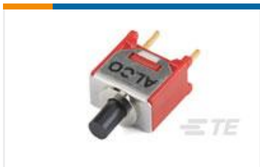
TE 产品编号2267072-4 PMS9P1B10M2QE