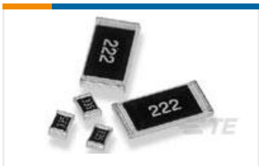
TE 产品编号2176186-9 CRGH1206 1% 560R 0.5W