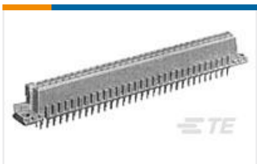
TE 产品编号5650860-5 ASSEMBLY,RECEPTACLE,EUROCARD, T