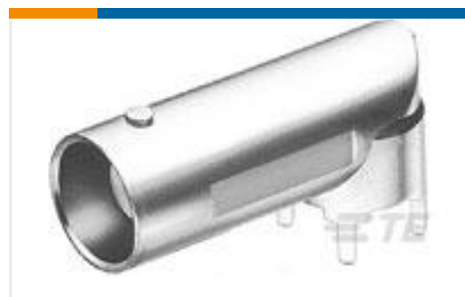
TE 产品编号413631-1 JACK,RTANG, PCB,50 OHM, BNC