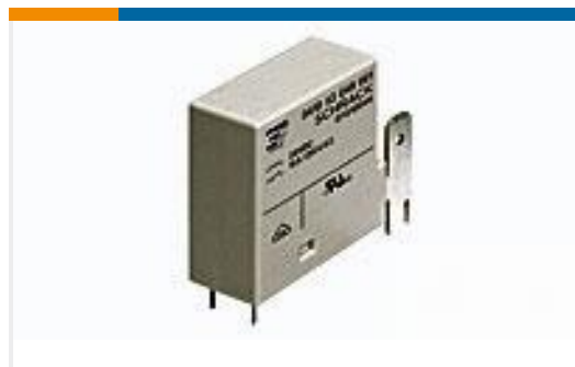
TE 产品编号8-1415536-6 0410 83 046 001WG