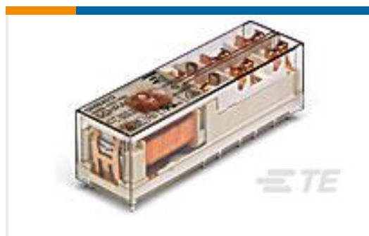
TE 产品编号6-1415027-1 SR6D4024