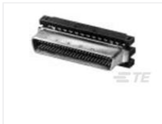
TE 产品编号5749111-1 20 50SR CABLE PLUG ASSY