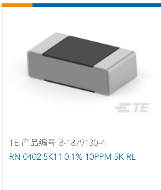
TE 产品编号 8-1879130-4 RN 0402 5K11 0.1% 10PPM 5K RL