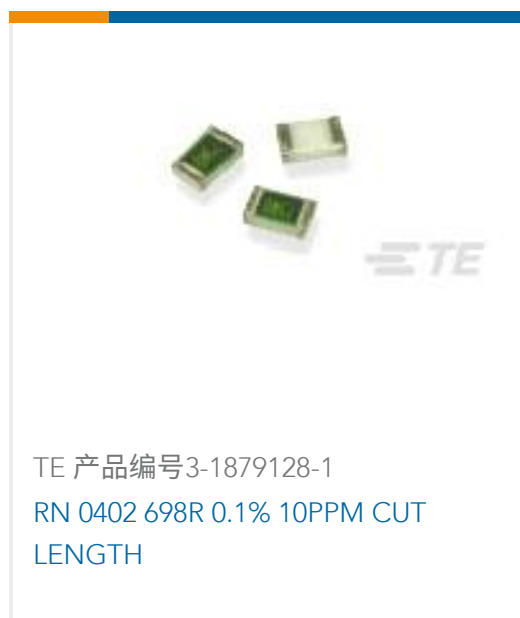
TE 产品编号3-1879128-1 RN 0402 698R 0.1% 10PPM CUT LENGTH