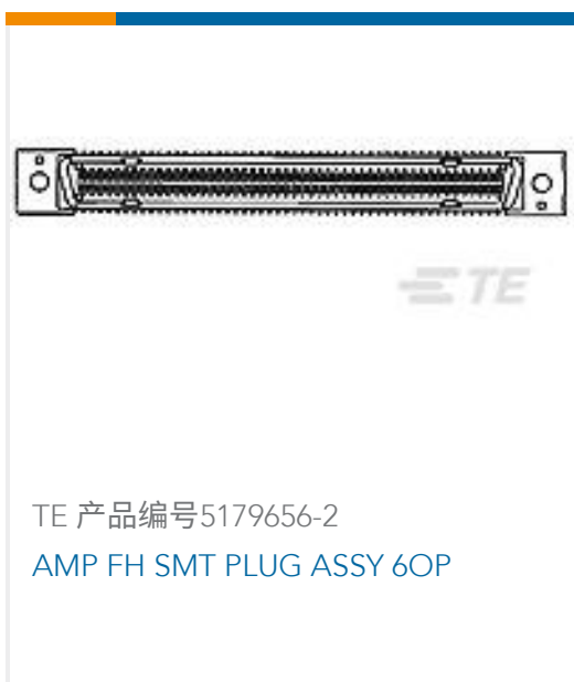
TE 产品编号5179656-2 AMP FH SMT PLUG ASSY 6OP