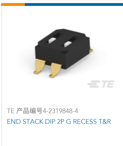
TE 产品编号4-2319848-4 END STACK DIP 2P G RECESS T&R