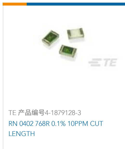
TE 产品编号4-1879128-3 RN 0402 768R 0.1% 10PPM CUT LENGTH