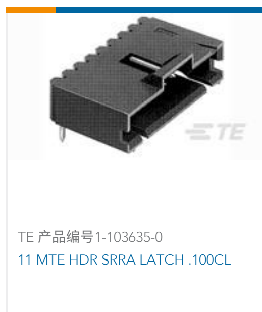
TE 产品编号1-103635-0 11 MTE HDR SRRA LATCH .100CL