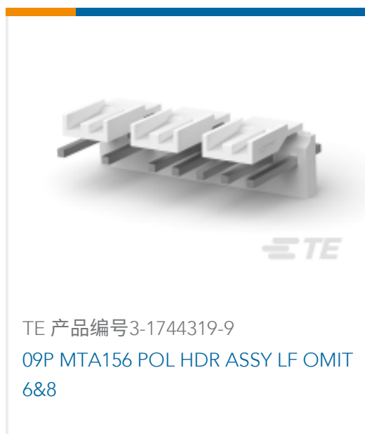
TE 产品编号3-1744319-9 09P MTA156 POL HDR ASSY LF OMIT 6&8