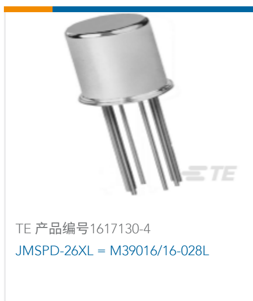
TE 产品编号1617130-4 JMSPD-26XL = M39016/16-028L