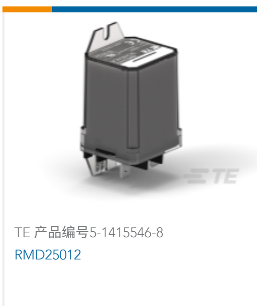
TE 产品编号5-1415546-8 RMD25012