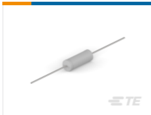
TE 产品编号6-2176412-6 5W XSM M/OX 5% 2K7