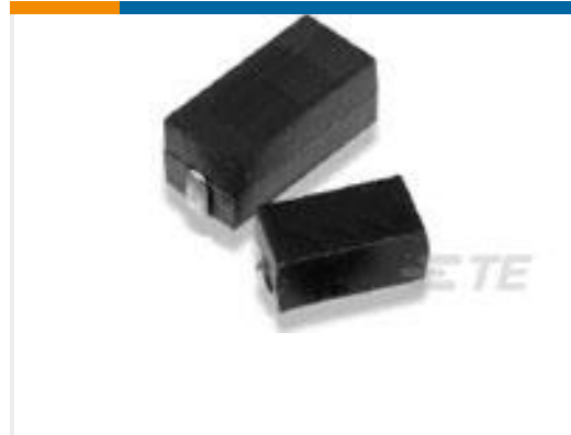
TE 产品编号6-1879021-7 SMW3 56R 5%