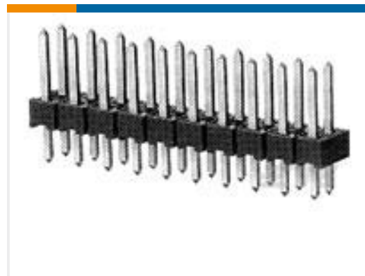
TE 产品编号826925-4 4P MOD2 STIFT LEI