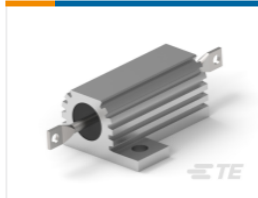
TE 产品编号2-1879071-7 功率电阻器：铝壳体，75 瓦特