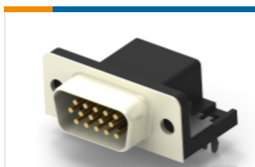
TE 产品编号2311774-1 AMPL PLUG, HD22, R/A, 15P, THREADED