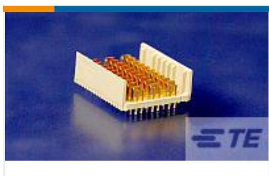
TE 产品编号6469083-1 HMZD 3PAIR, HDR ASSY, 25MM MOD