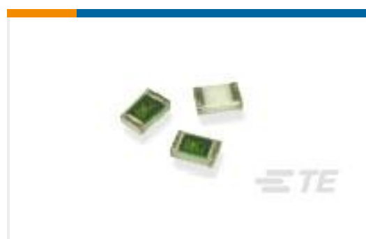
TE 产品编号6-1625867-3 RP 1J 0.166W 27R4 0.1% 25PPM 1K RL