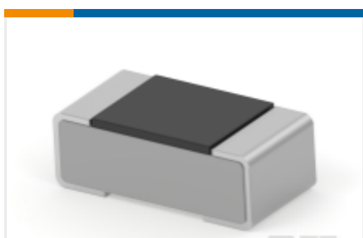
TE 产品编号2176338-2 CRGCQ 0402 1R5 5%