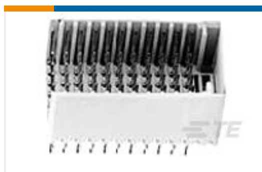
TE 产品编号5106081-1 2MM HM, HEADER, TYPE C