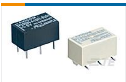
TE 产品编号3-1393774-5 V23026B1102B201