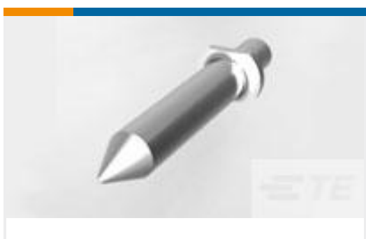
TE 产品编号223956-1 STV ERMZUB FUEHRUNGSBOLZEN J *M1***