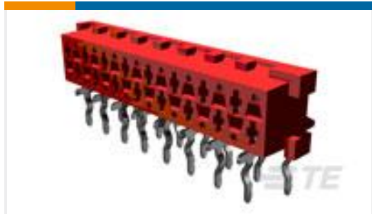
TE 产品编号1-215460-4 MICRO-MATCH FEM.SE