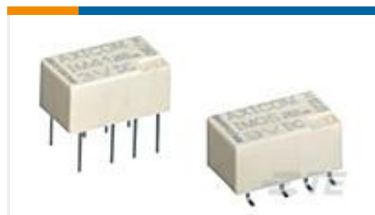
TE 产品编号4-1462037-0 IM01JR=IM RELAY 140mW 3V