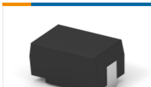
TE 产品编号7-1676966-3 SMD 功率电阻器：7 瓦特，200-2M 欧姆