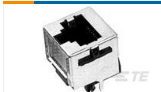
TE 产品编号5557730-1 MJ,TE,8P/8C,SHLD,PNL STOPS&G