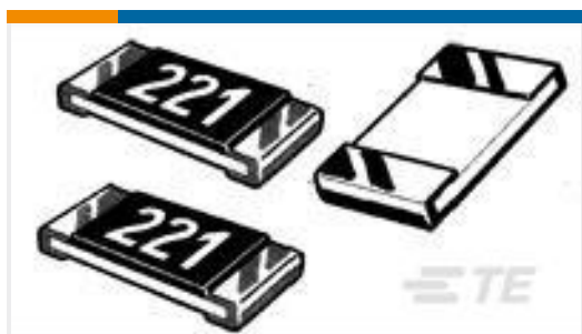
TE 产品编号9-2176231-1 3522 56K 1% 3W