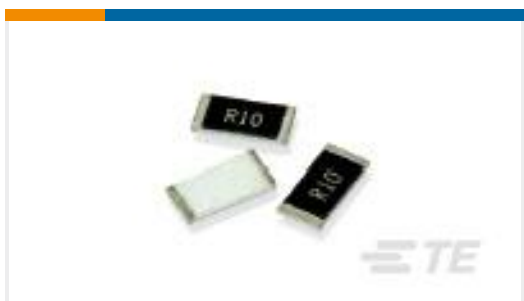
TE 产品编号1-2176054-8 RLP73N 2A R27 5% 5K RL