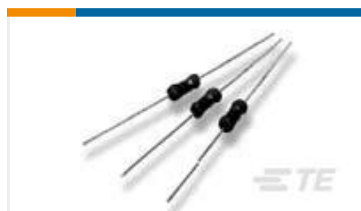
TE 产品编号7-1879354-5 RR03 5% 390R AMMO