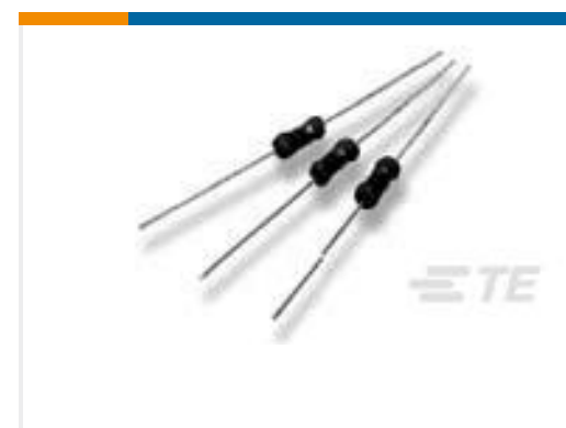
TE 产品编号1-1879353-9 RR02 5% 24K AMMO