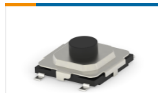
TE 产品编号2337238-3 TACT MINI GW 5.2X5.2X2 160GF