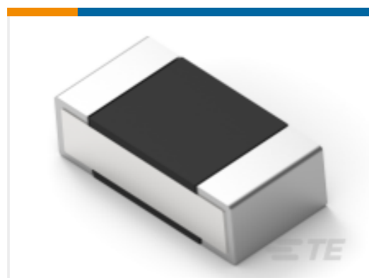
TE 产品编号3-2176307-2 RP 1E 0.1W 26K1 0.1% 25PPM 5K RL