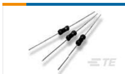
TE 产品编号7-1879354-5 RR03 5% 390R AMMO