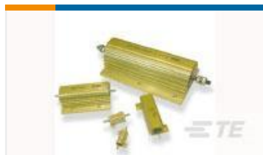
TE 产品编号9-1625971-5 HSA25 R01 10%