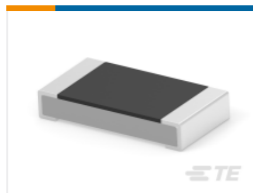
TE 产品编号2-2176392-9 RQ 1206 261K 0.1% 10PPM 5K RL