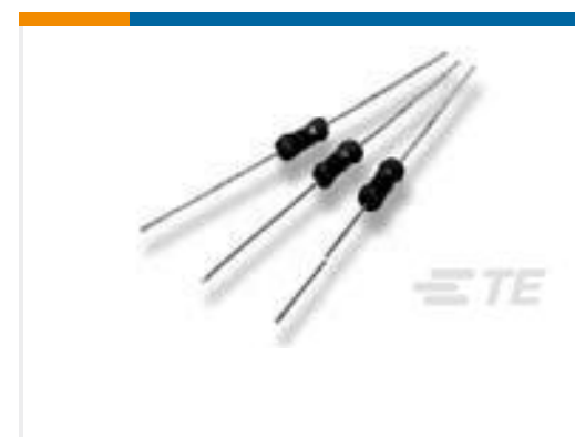
TE 产品编号1-1879353-9 RR02 5% 24K AMMO