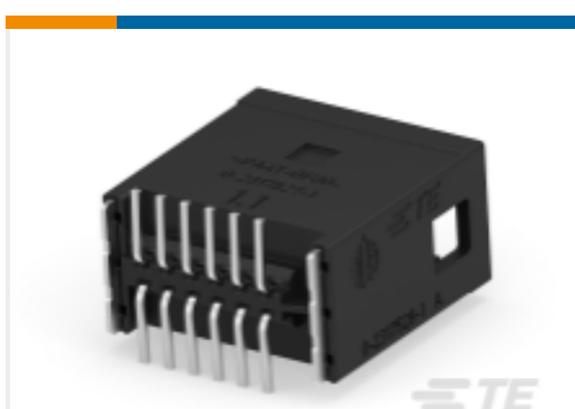
TE 产品编号2317527-1 2X6POS,NANOMQS,HDR ASSY, 180DEG,SMD,COD A