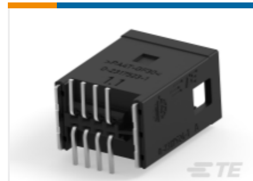
TE 产品编号2317523-1 2X4POS,NANOMQS,HDR ASSY, 180DEG,SMD,COD A