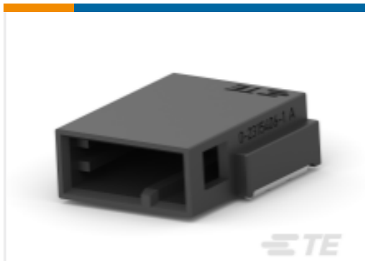
TE 产品编号2315405-1 4POS,TAB0.5X0.4,HDR ASSY,90DEG, COD A