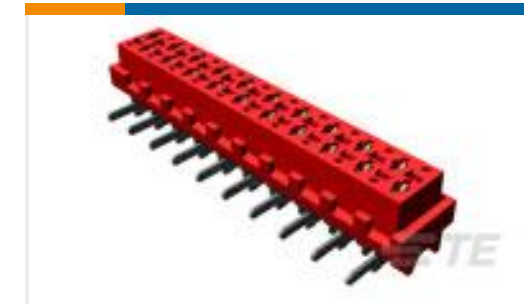
TE 产品编号9-188431-0 M-MATCH FEM. BOTTOM ENTRY SMD INB.CONN.