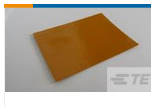
TE 产品编号7-1437139-7 FSN-21A-15=NOMEX FS STD