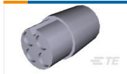
TE 产品编号925076-3 4W CIRCULAR MATE-N-LOK SOCKET HSG BLK