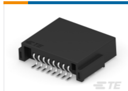
TE 产品编号2315411-1 8POS,TAB0.5X0.4,HDR ASSY,90DEG, COD A