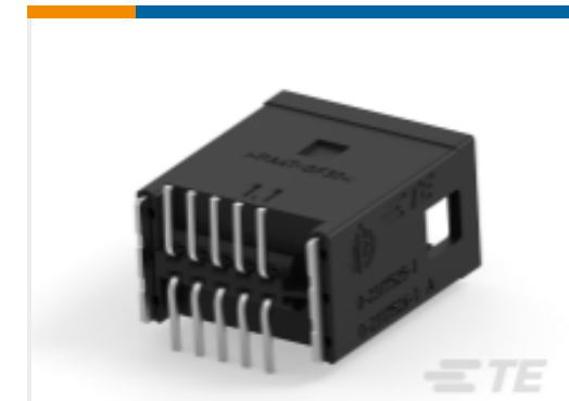
TE 产品编号2317525-1 2X5POS,NANOMQS,HDR ASSY, 180DEG,SMD,COD A