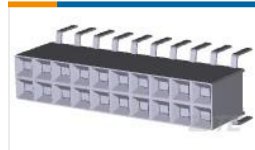
TE 产品编号534267-2 20 MODIV VRT DR OE 100/125