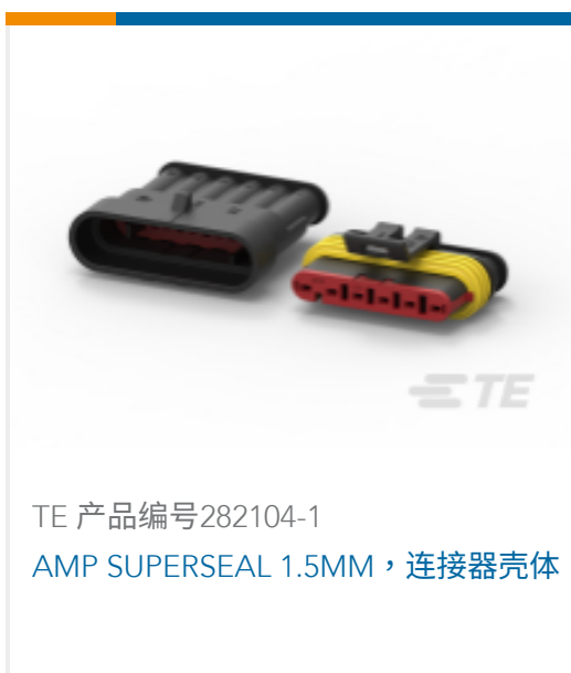
TE 产品编号 282104-1 AMP SUPERSEAL 1.5MM, 连接器壳体