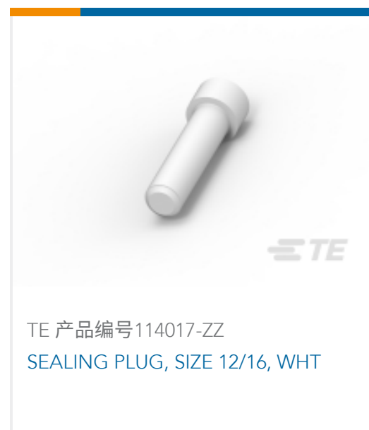
TE 产品编号 114017-ZZ SEALING PLUG, SIZE 12/16, WHT