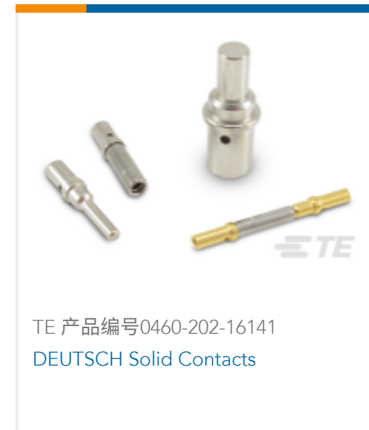
TE 产品编号 0460-202-16141 DEUTSCH Solid Contacts