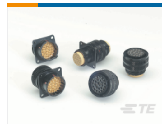
TE 产品编号ZPF000000000096565 FDDBA 57-14-5 PN-K 090 A838