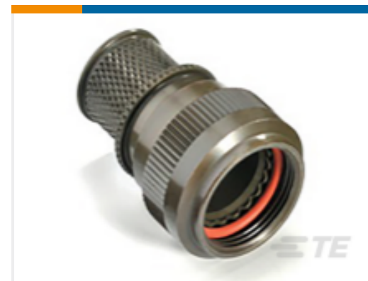
TE 产品编号BTA1-24-13-1-C BTA1-24-13-1-C