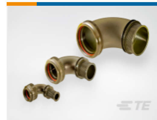
TE 产品编号BTA3-28-13-4-J BTA3-28-13-4-J