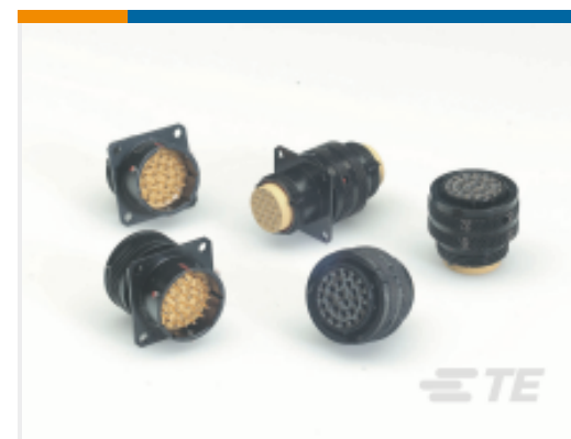
TE 产品编号ZPF000000000100155 FDDBA 57-12-3 SN-K 090 A838