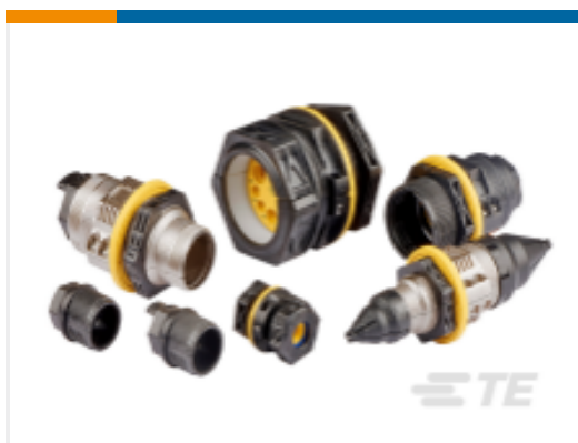
TE 产品编号ZPF000000000099321 D-EASY 03 B 03