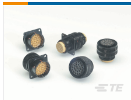
TE 产品编号ZPF000000000095953 FDDBA 50-14-15 PN-K 090 A499