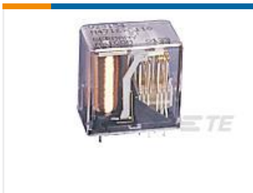
TE 产品编号3-1393812-4 V23054C2013B104