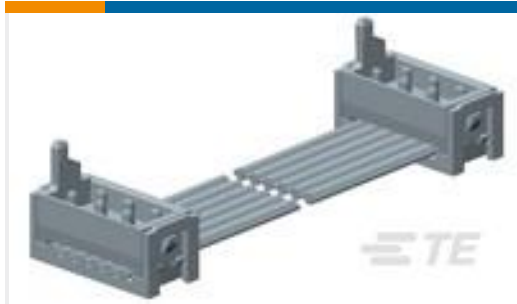
TE 产品编号1483351-3 MICRO-MATCH LEAD 06P 250MM