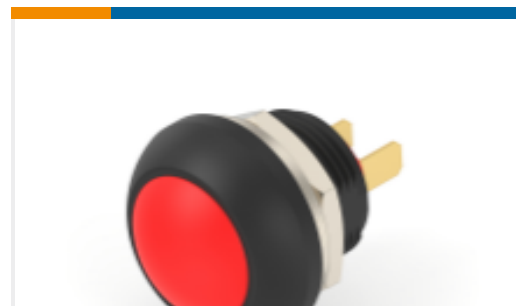
TE 产品编号2329360-7 PB OFF/ON RC RED M2 TERM. IP68