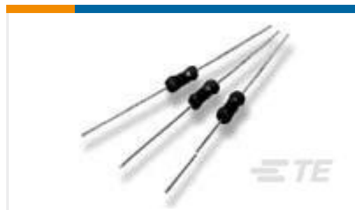
TE 产品编号5-1625885-2 1W SM M/OX 5% 27R