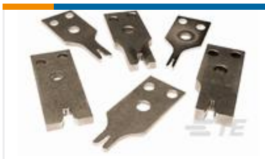
TE 产品编号2-568176-1 CRIMPER, WIRE