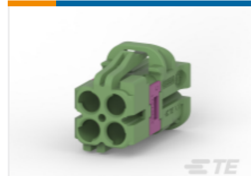
TE 产品编号2298721-5 4P,MATE-AX,SOC HSG ASSY,180DEG, COD E