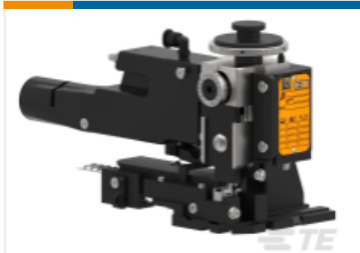
TE 产品编号2836027-2 OC-AT-S-FA-133F291F-059-1104