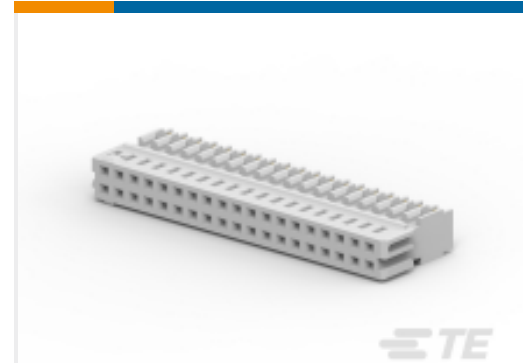
TE 产品编号1241026-1 MODU TSP BUSTE2X19P