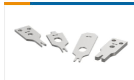
CRIMPER REPRESENTATION ONLY