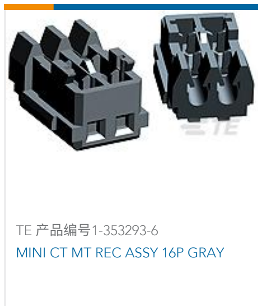
TE 产品编号1-353293-6 MINI CT MT REC ASSY 16P GRAY