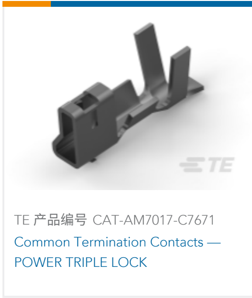
TE 产品编号 CAT-AM7017-C7671 Common Termination Contacts — POWER TRIPLE LOCK