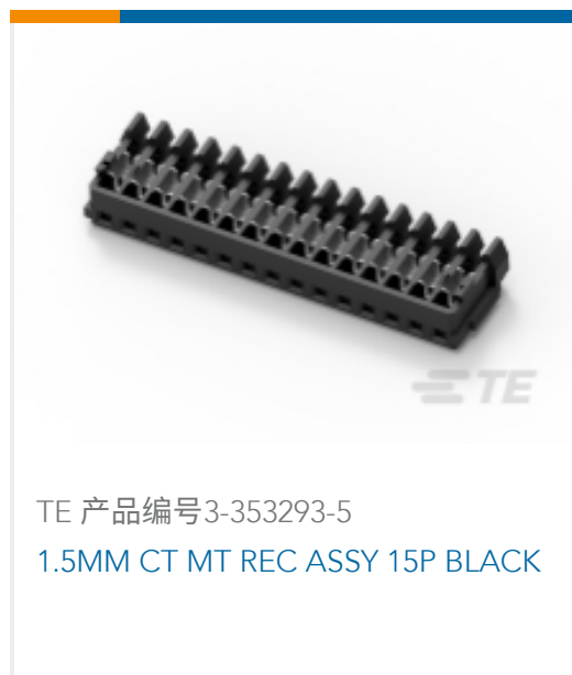
TE 产品编号3-353293-5 1.5MM CT MT REC ASSY 15P BLACK