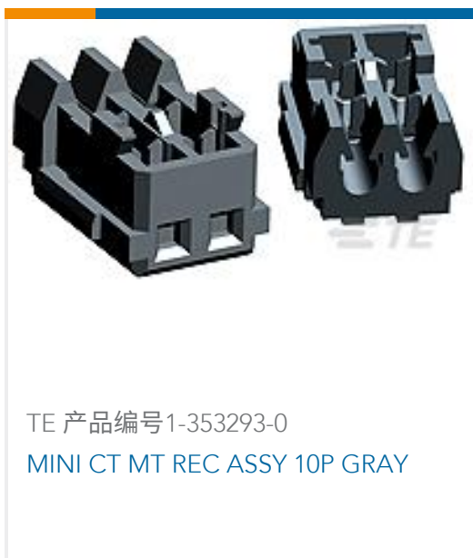
TE 产品编号1-353293-0 MINI CT MT REC ASSY 10P GRAY