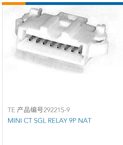
TE 产品编号292215-9 MINI CT SGL RELAY 9P NAT