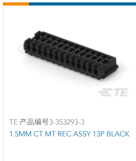
TE 产品编号3-353293-3 1.5MM CT MT REC ASSY 13P BLACK