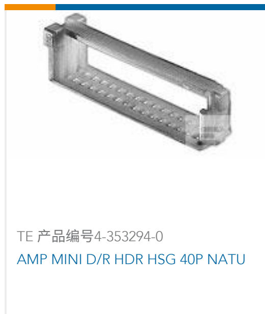
TE 产品编号4-353294-0 AMP MINI D/R HDR HSG 40P NATU