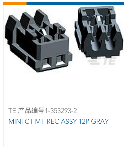
TE 产品编号1-353293-2 MINI CT MT REC ASSY 12P GRAY