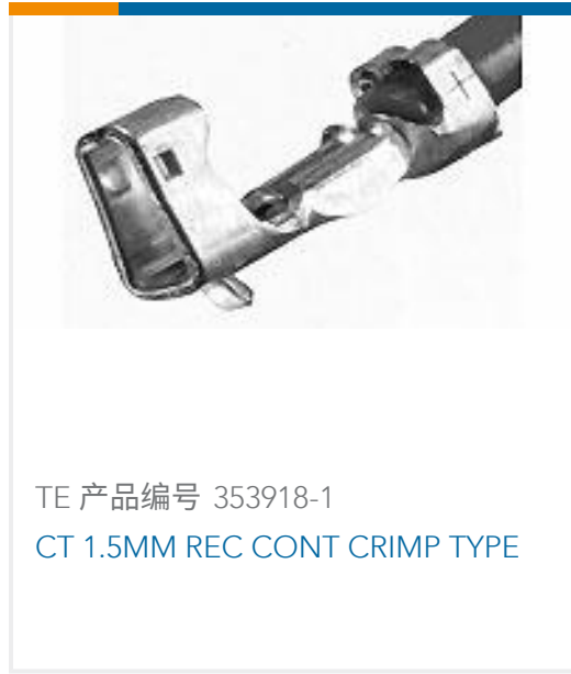
TE 产品编号 353918-1 CT 1.5MM REC CONT CRIMP TYPE