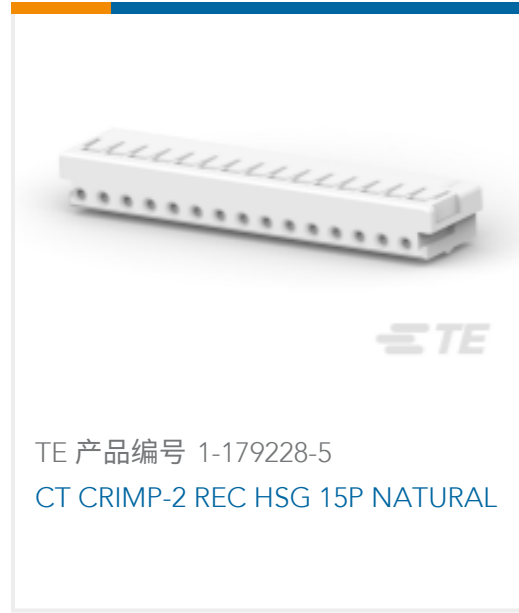
TE 产品编号 1-179228-5 CT CRIMP-2 REC HSG 15P NATURAL