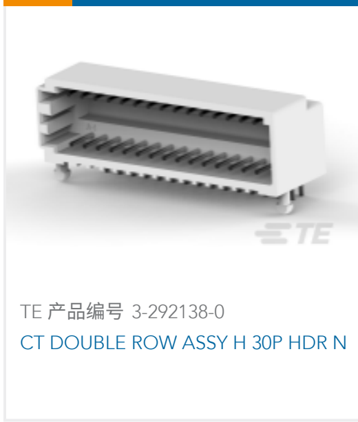
TE 产品编号 3-292138-0 CT DOUBLE ROW ASSY H 30P HDR N