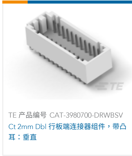
TE 产品编号 CAT-3980700-DRWBSV Ct 2mm Dbl 行板端连接器组件，带凸 耳：垂直