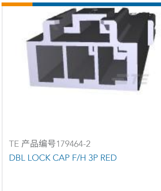
TE 产品编号179464-2 DBL LOCK CAP F/H 3P RED