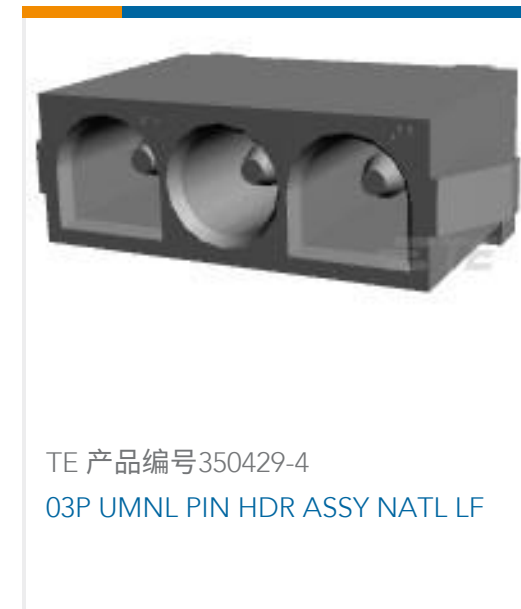
TE 产品编号350429-4 03P UMNL PIN HDR ASSY NATL LF