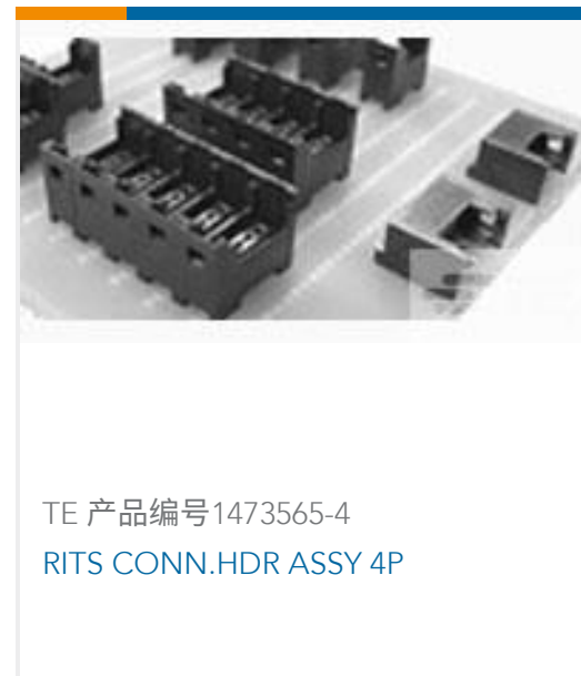
TE 产品编号1473565-4 RITS CONN.HDR ASSY 4P