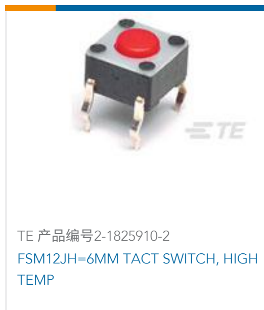
TE 产品编号2-1825910-2 FSM12JH=6MM TACT SWITCH, HIGH TEMP