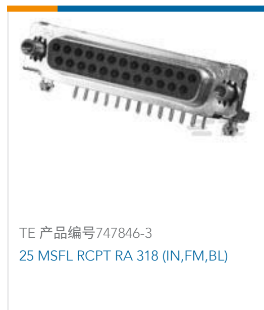
TE 产品编号747846-3 25 MSFL RCPT RA 318 (IN,FM,BL)