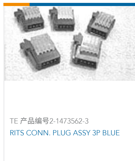
TE 产品编号2-1473562-3 RITS CONN. PLUG ASSY 3P BLUE