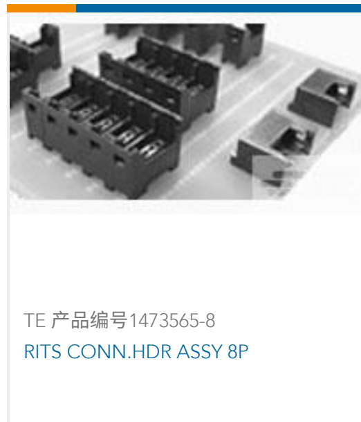
TE 产品编号1473565-8 RITS CONN.HDR ASSY 8P