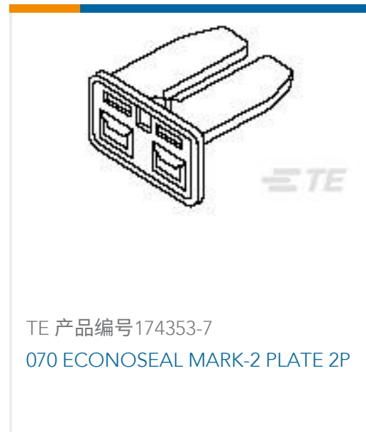
TE 产品编号174353-7 070 ECONOSEAL MARK-2 PLATE 2P