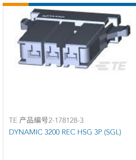
TE 产品编号2-178128-3 DYNAMIC 3200 REC HSG 3P (SGL)