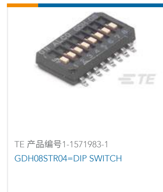
TE 产品编号1-1571983-1 GDH08STR04=DIP SWITCH