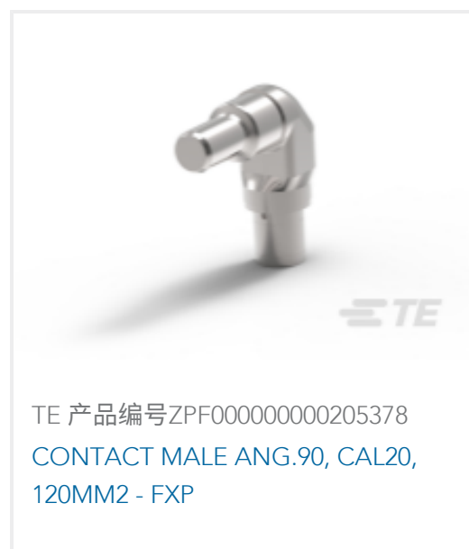
TE 产品编号ZPF000000000205378 CONTACT MALE ANG.90, CAL20, 120MM2 - FXP