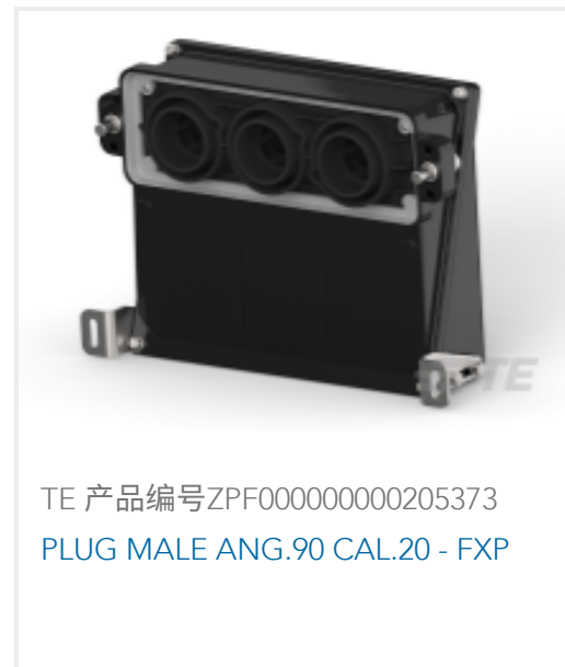
TE 产品编号ZPF000000000205373 PLUG MALE ANG.90 CAL.20 - FXP