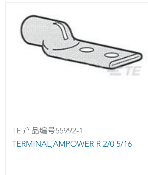
TE 产品编号55992-1 TERMINAL,AMPOWER R 2/0 5/16