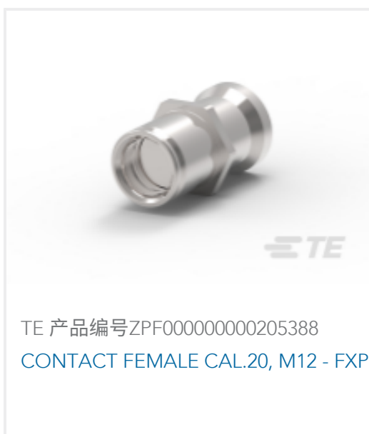
TE 产品编号ZPF000000000205388 CONTACT FEMALE CAL.20, M12 - FXP