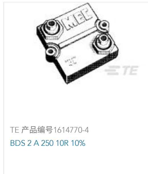
TE 产品编号1614770-4 BDS 2 A 250 10R 10%