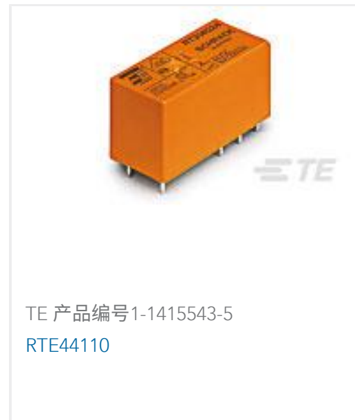
TE 产品编号1-1415543-5 RTE44110