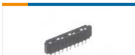
TE 产品编号5-520315-3 TRIOMATE ASSY V 3P L=3.556LDFR