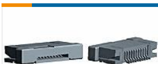
TE 产品编号2-1734592-9 FPC CONN. 0.5MM PITCH B/C, 29P