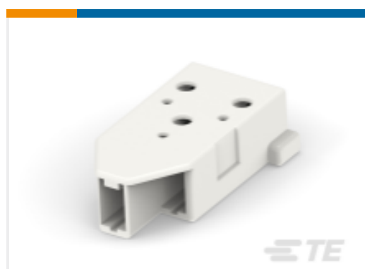
TE 产品编号316293-3 3.2 CLUSTER BLOCK HSG, LCP TYPE 3P