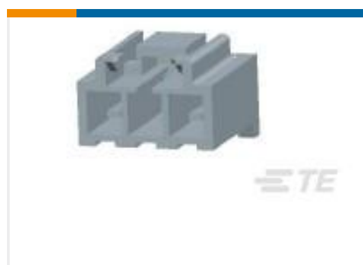
TE 产品编号3-176976-4 UNIV.POWER HDR ASSY 3P