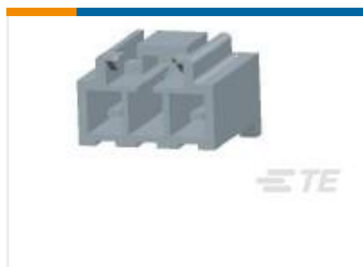
TE 产品编号3-176976-2 UNIV POWER HDR ASSY 3P RED