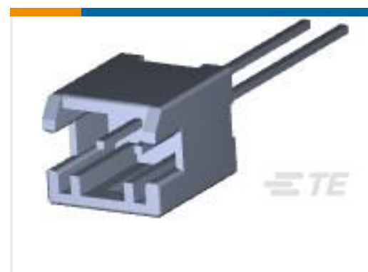
TE 产品编号6-1376492-2 2.5 SMC HDR 2POS RED TAPE