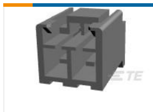
TE 产品编号9-176975-1 AMP UNIVERSAL POWER PLG 2P PCB