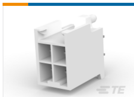
TE 产品编号179846-6 STD 温度电源双重锁定板端连接器