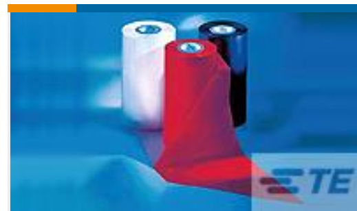
TE 产品编号F55931-000 1966-RIBBON