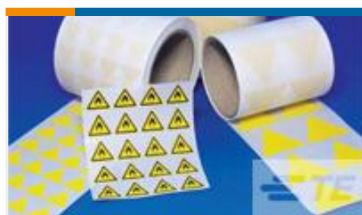
TE 产品编号 4-1768017-0 EET-0606P-4