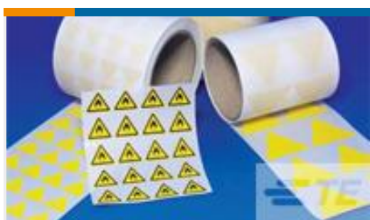
TE 产品编号 3-1768017-5 EET-0538P-4