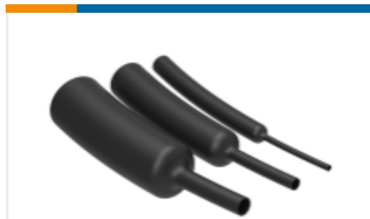
TE 产品编号5677574004 RNF-3000 Heat Shrink Tubing