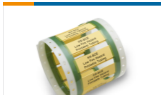
TE 产品编号D15532-000 HX-SCE Low Fire Hazard Sleeves