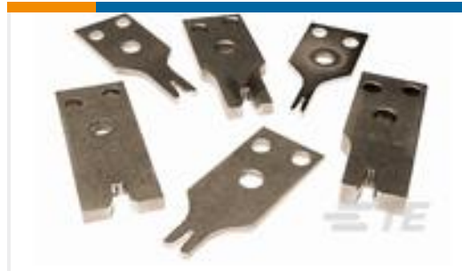
TE 产品编号1-409282-0 CRIMPER,INS