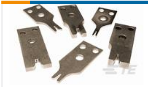
TE 产品编号1-409282-9 CRIMPER,INSULATION