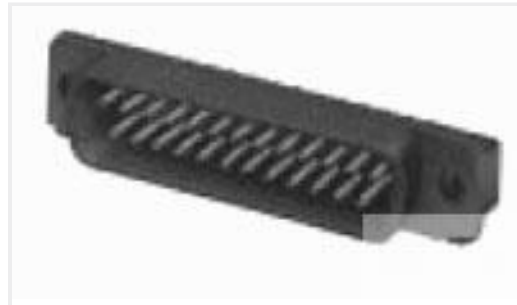
TE 产品编号5745071-1 HD-20 PLUG 9P VERT FFSCRLK