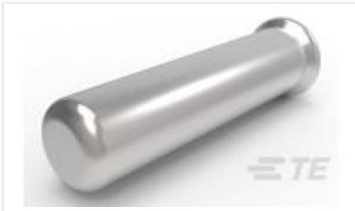
TE 产品编号5050871-8 SOCKET,MIN-SPR SN SER-5