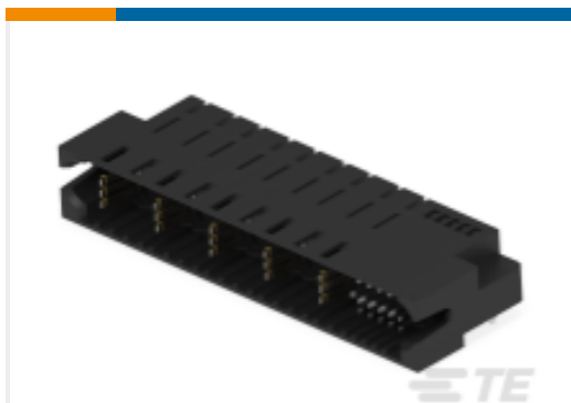
TE 产品编号2391132-3 MB Lite,R/A,HDR,SOLDER,5LP+25S