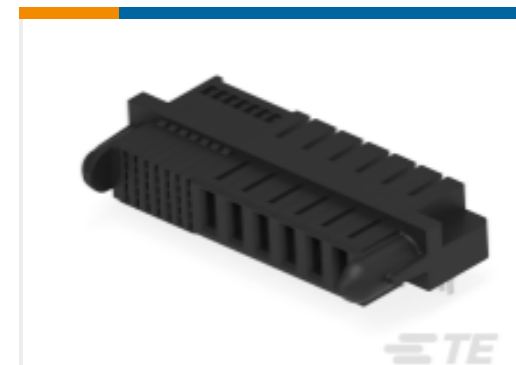
TE 产品编号2391172-2 MB Lite,R/A,REC,SOLDER,5LP+25S