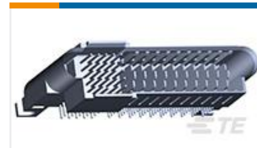
TE 产品编号1926736-3 MiniPAK HDL, 25s10p, RA Plug,