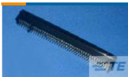
TE 产品编号 1734774-1 PCI EXP 3.1L 36 POS WHT G/F