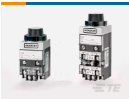
TE 产品编号 2-1423157-4 7012AK=RLY,STD,ON,2P,120VAC,30