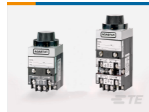
TE 产品编号 1755170-1 7022OCIM=RLY,STD,OFF,2P,24V,15S,I, M