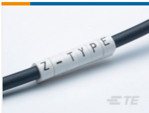
TE 产品编号 EC0437-000 06153411