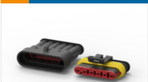
TE 产品编号282104-1 AMP SUPERSEAL 1.5MM，连接器壳体