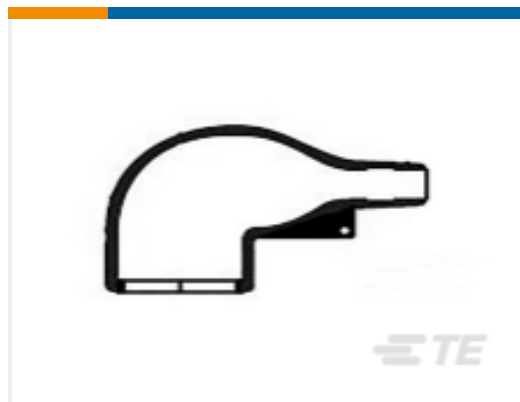
TE 产品编号EF9981-000 222K121-25L/225-0