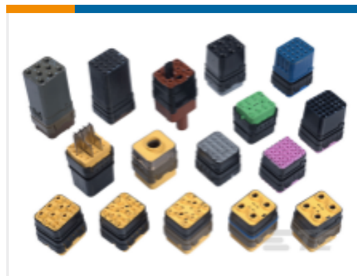
TE 产品编号ZPF00000000148762 DMC-M 99-04 AN (=33537-P0000)