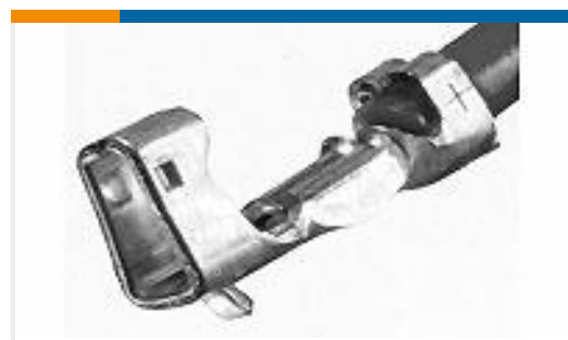
TE 产品编号 353918-1 CT 1.5MM REC CONT CRIMP TYPE