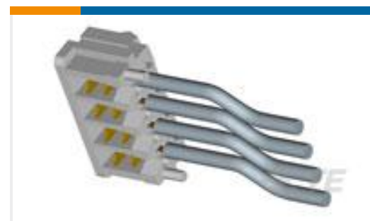
TE 产品编号 3-173977-5 CT MT REC ASSY 15P BLUE