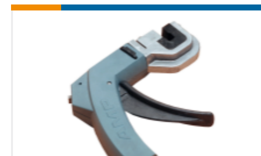
TE 产品编号 58372-1 HEAD (IDC) 2MM C.T. W/O TL FRAME