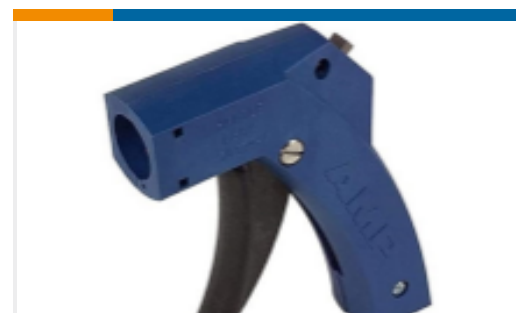
TE 产品编号 58074-1 MTA 50/100/156 MANUAL TOOL FRAME