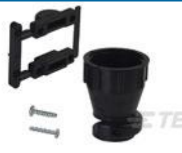
TE 产品编号 206070-8 CABLE CLAMP KIT #17