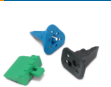
TE 产品编号 W2S Wedgelocks: DEUTSCH DT