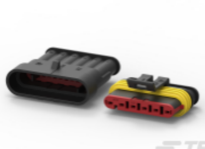
TE 产品编号 282104-1 AMP SUPERSEAL 1.5MM, 连接器壳体