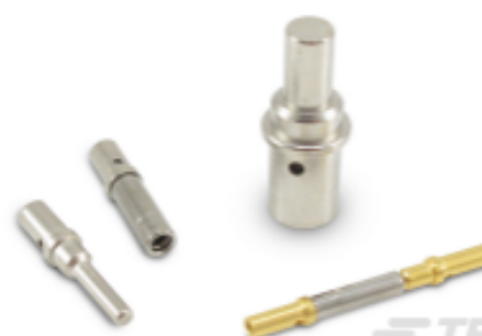
TE 产品编号 0460-202-16141 DEUTSCH Solid Contacts