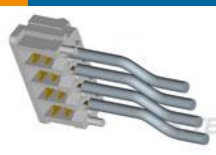
TE 产品编号 3-173977-3 CT CONN MT REC ASSY 13P BLUE