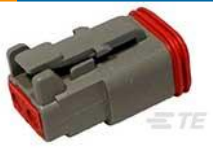
TE 产品编号 DT06-2S PLG, 2P, GRY, N