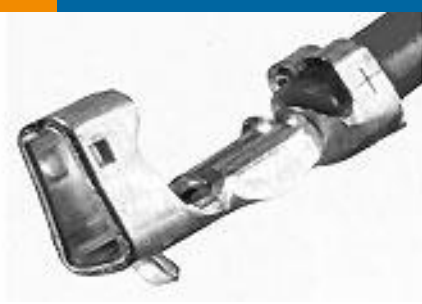
TE 产品编号 353918-1 CT 1.5MM REC CONT CRIMP TYPE