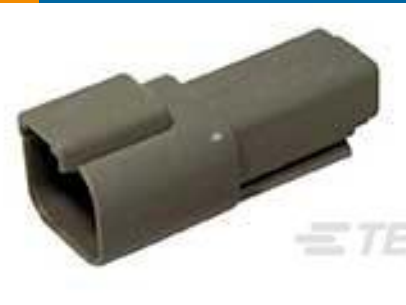
TE 产品编号 DT04-2P REC, 2P, GRY, N