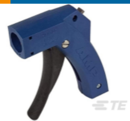
TE 产品编号 58074-1 MTA 50/100/156 MANUAL TOOL FRAME