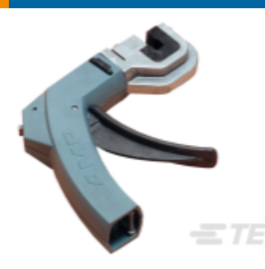
TE 产品编号 58372-1 HEAD (IDC) 2MM C.T. W/O TL FRAME