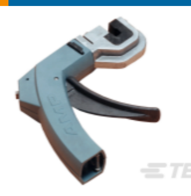
TE 产品编号 58372-1 HEAD (IDC) 2MM C.T. W/O TL FRAME