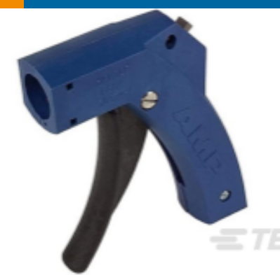
TE 产品编号 58074-1 MTA 50/100/156 MANUAL TOOL FRAME