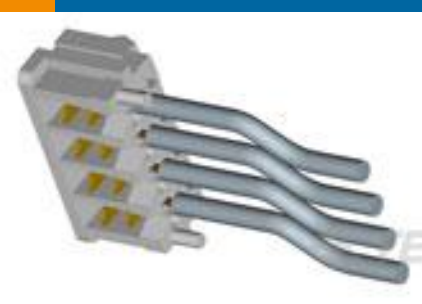
TE 产品编号 3-173977-1 AMP CT REC ASSY 11P BLUE