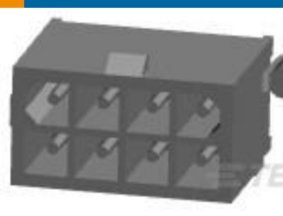
TE 产品编号 1-794073-1 08P MINI UMNL HDR W/O DH AU LF