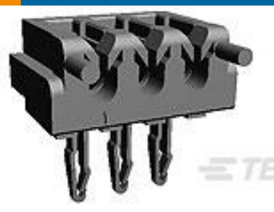
TE 产品编号 2-173983-4 AMP CT MT AMP-IN HDR-H YEL 4P