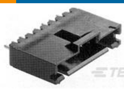
TE 产品编号 5-104363-6 07 MTE HDR SRST LATCH .100CL