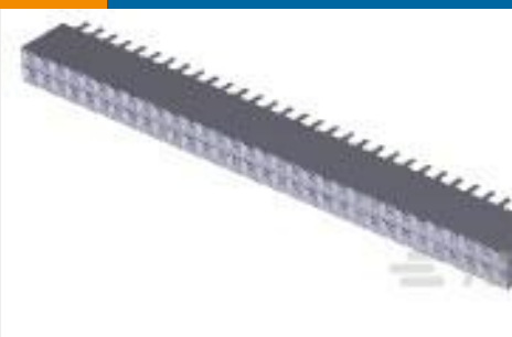
TE 产品编号 3-534206-2 64 MODII VRT DR CE 100/115