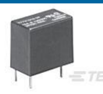
TE 产品编号 1-1393194-5 T77S1D3-12