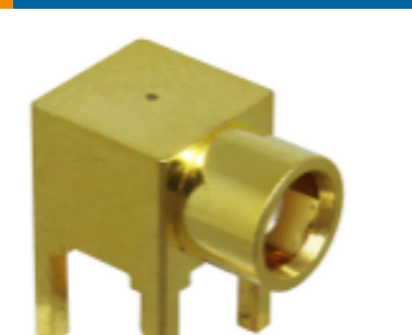
TE 产品编号 CONMCX002 MCX Jack 50 Ohm PCB Through Hole