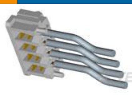
TE 产品编号 3-173977-0 CT MT REC ASSY 10P BLUE