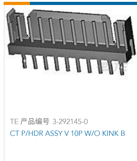
TE 产品编号 3-292145-0 CT P/HDR ASSY V 10P W/O KINK B