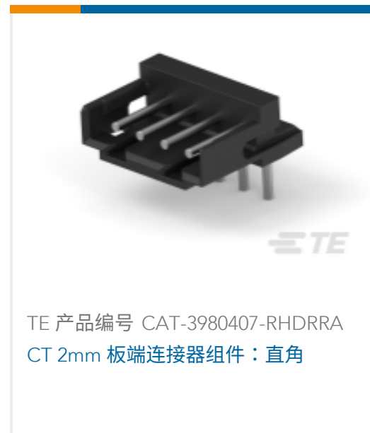
TE 产品编号 CAT-3980407-RHDRRA CT 2mm 板端连接器组件：直角