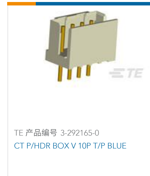
TE 产品编号 3-292165-0 CT P/HDR BOX V 10P T/P BLUE