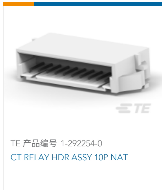
TE 产品编号 1-292254-0 CT RELAY HDR ASSY 10P NAT