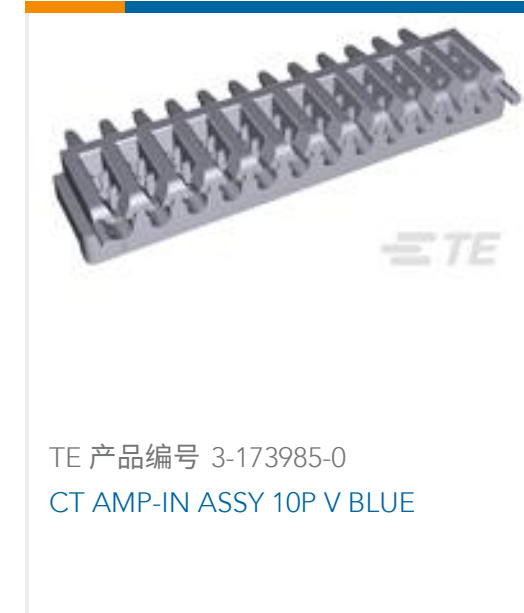
TE 产品编号 3-173985-0 CT AMP-IN ASSY 10P V BLUE