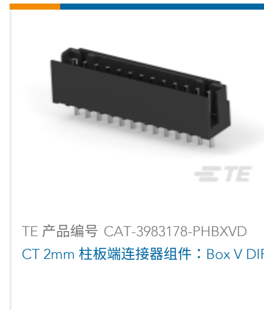
TE 产品编号 CAT-3983178-PHBXVD CT 2mm 柱板端连接器组件：Box V DIP