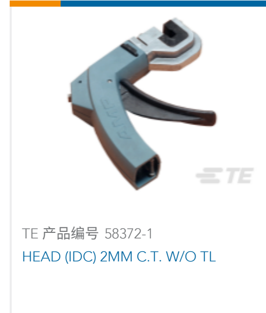
TE 产品编号 58372-1 HEAD (IDC) 2MM C.T. W/O TL