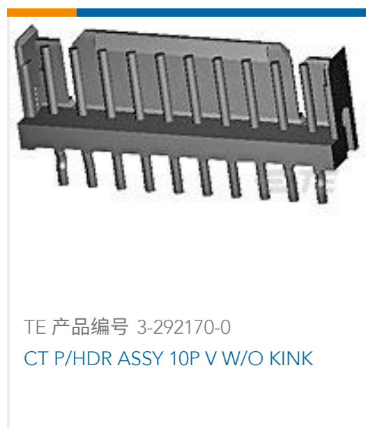
TE 产品编号 3-292170-0 CT P/HDR ASSY 10P V W/O KINK