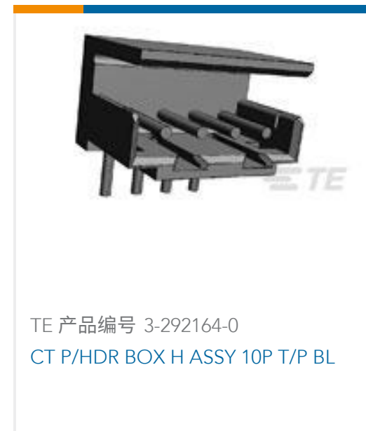
TE 产品编号 3-292164-0 CT P/HDR BOX H ASSY 10P T/P BL