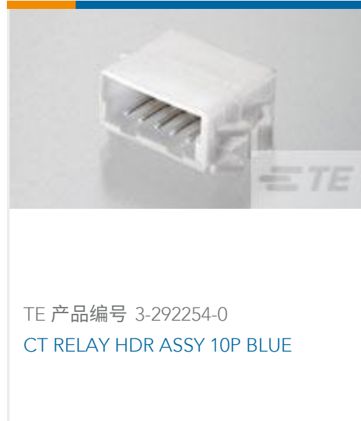
TE 产品编号 3-292254-0 CT RELAY HDR ASSY 10P BLUE