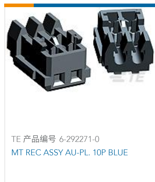
TE 产品编号 6-292271-0 MT REC ASSY AU-PL. 10P BLUE