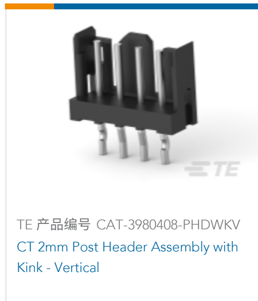
TE 产品编号 CAT-3980408-PHDWKV CT 2mm Post Header Assembly with Kink - Vertical