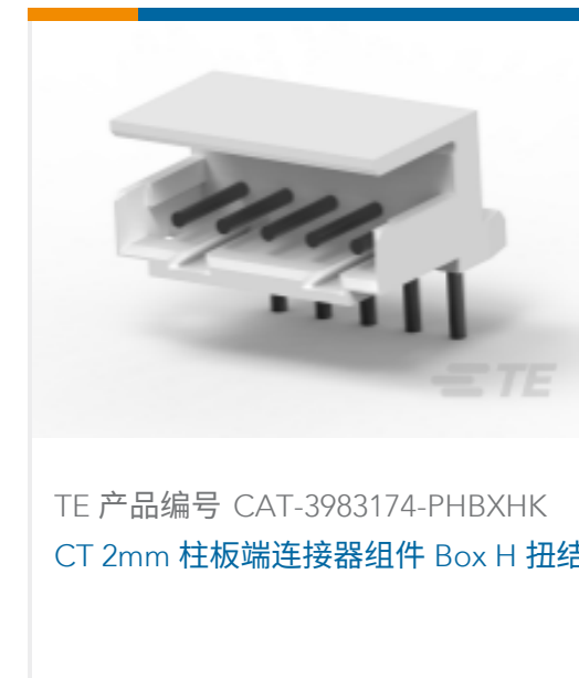
TE 产品编号 CAT-3983174-PHBXHK CT 2mm 柱板端连接器组件 Box H 扭结