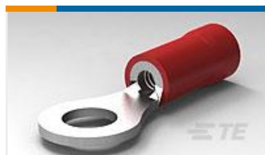
TE 产品编号34148 PG R 22-16 COMM 22-18 MIL 8