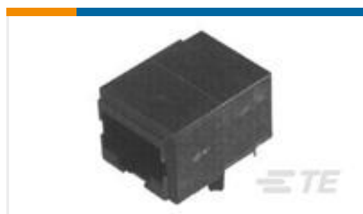
TE 产品编号5557785-1 MJ,8POS,R/A,LPF